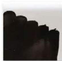
S/C MARRÓN CHOCOLATE 229