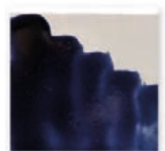
S/C AZUL 233