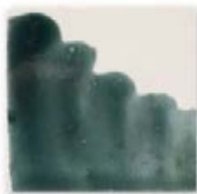
S/C CELADON 243