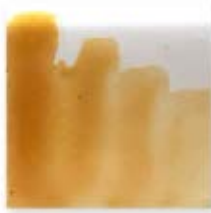
S/C OCRE VIEJO 216