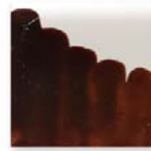
S/C MARRÓN ROJIZO 204