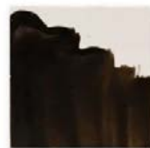
S/C MARRÓN IMPERIO 280