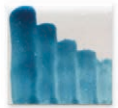
S/C CELESTE 207