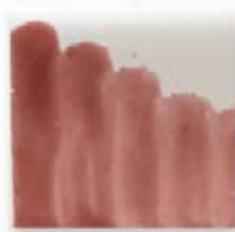
S/C ROSADO 218