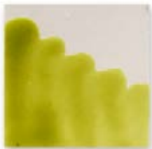
S/C VERDE CHARTREUSE 242