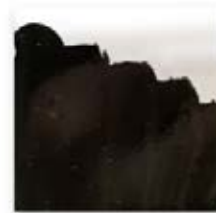
S/C NEGRO 230