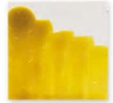
S/C AMARILLO 214