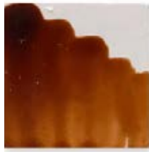
S/C MARRÓN CLARO 201