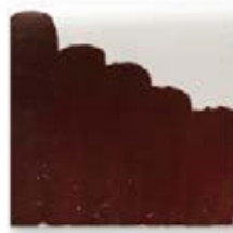
S/C ROJO POMPADOUR 203