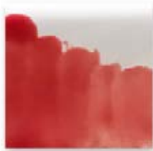
S/C ROJO 227