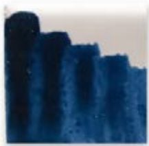
S/C AZUL 234