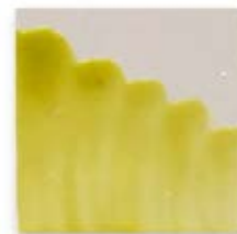
S/C LIMÓN 240