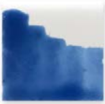
S/C AZUL INTENSO 210