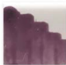
S/C LAVANDA 239