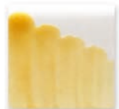
S/C DORADO 307