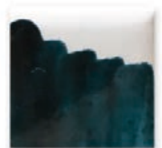
S/C TURQUESA 221