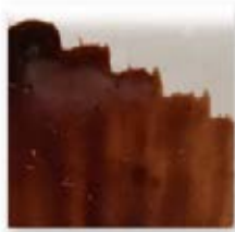
S/C MARRÓN RICH BROWN 238