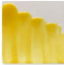
S/C AMARILLO 215