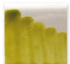
S/C VERDE MANZANA 241