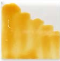
S/C OCRE 209