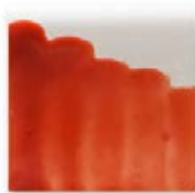
S/C NARANJA 219