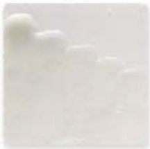
S/C BLANCO 200

Son utilizados en tercera cocción sobre esmaltes cocidos. De uso decorativo ya que contienen fritas con plomo.