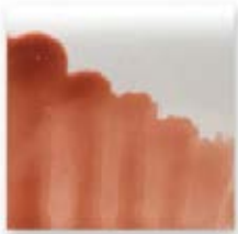
S/C ROSA SALMÓN 224

Son utilizados en tercera cocción sobre esmaltes cocidos. De uso decorativo ya que contienen fritas con plomo.