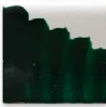
S/C VERDE 208